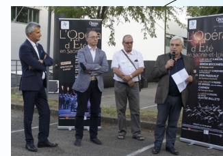
Premier Opéra d'Été - Mâcon, 19 juillet 2018 En partenariat avec le Conseil Départemental 71

C'est donner une voix aux acteurs associatifs ruraux auprès des instances intercommunales, départementales, régionales, nationales, voire européennes. C'est peser pour faire reconnaître par les politiques publiques les enjeux des territoires ruraux et le rôle du monde associatif dans leur vitalité.