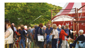
Fédestival #2 Juin-Juillet 2022 / La-Chapelle-sous-Brancion

L'ensemble des associations qui composent la FDFR 71, c'est vous !