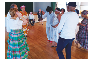
Atelier danse Quadrille Quand Morvan et Outre-Mer se rencontrent... Avril 2023 / Épinac