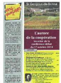
Les actes de la conférence de Saint-Gengoux-de-Scissé

Croisement de savoirs entre historiens, scientifiques et viticulteurs producteurs de nos vins d'excellence, entre autres Mâcon-Bray, Mâcon-Lugny, Montagny-lès-Buxy, Moulin-à-vent, Pouilly-Fuissé, Saint-Véran, Viré-Clessé, Vin des Fossiles du Brionnais, l'exposition met à disposition des visiteurs des actes de conférences-débats. Lors de chaque inauguration, ces conférences ont été animées par les foyers ruraux puis transcrites par le comité de pilotage à la Fédération.