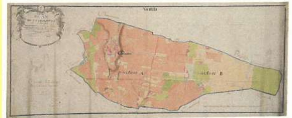
Plan cadastral, 1805 (Arch. dép. Saône-et-Loire). Les vignes figurent en rose. Au Moyen Âge, le paysage devait également être marqué par la présence du vignoble, mais en petites parcelles entrecoupées de jardins, de champs, de vergers...

À la fin du Moyen Âge, les Templiers de la commanderie de Mâcon (puis Hospitaliers de Saint-Jean de Jérusalem), se partagent les dîmes en grains et en vin avec le curé de Chaintré. Jusqu'à la Révolution, 1/16 e du raisin vendangé devait être apporté dans la grange du curé, près de l'église romane (actuelle impasse de la Cure). Un pressoir et deux cuves permettaient de traiter la récolte.