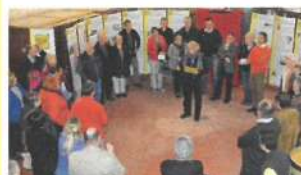
À Bray, présentation de la démarche