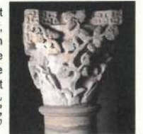
Abbaye de Cluny, chapiteau du Paradis, la vigne folle (Musée d'art et d'archéologie de Cluny)

À la même époque, un établissement religieux récent veut s'implanter à Chaintré : l'abbaye de Cluny, qui reçoit en 950 « une vigne avec un jardin, et un manse (maison) » du prêtre Engelbert. À en croire les chartes, Cluny n'aurait pas bénéficié d'autre donation dans ce village – l'assise de Saint-Vincent y était probablement trop forte.