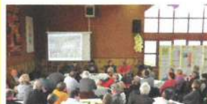
La conférence à Laizé