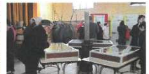
L'exposition à Romanèche