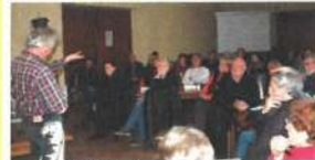
La conférence-débat à Azé

Les 8 premiers panneaux présentent une perception et une réflexion sur les caractéristiques des vins et vignobles de Saône-et-Loire dans une perspective historique : de la vigne dans le paysage gallo-romain à l'actualité des recherches sur le vignoble, en passant par différentes époques autour du commerce, des mouvements coopératifs et des syndicats viticoles.