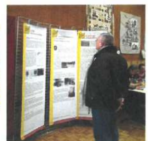
À Charbonnières, une lecture attentive