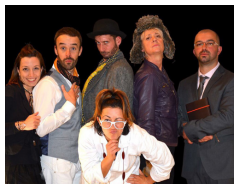
Théâtre d'Efie Et pourquoi pas vous ?