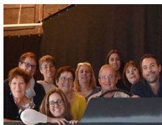
Acrêchcoeur Les Femmes de la Petite Couronne