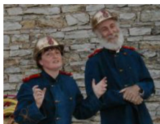
Duo G.M. A.G.é-e-s