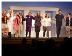
La Parodienne La Surprise