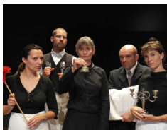
Les Fameux Fonds de Tiroir Maudite Clochette