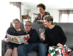
Théâtre en Scène Moi, je crois pas